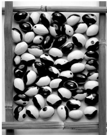
Foto: Ying-yang bonen voor in de moestuin

Een boerderij is voor kinderen een plek waar veel te beleven is en waar kinderen de ruimte hebben om te spelen. Een veilige en prettige sfeer binnen kinderopvang Tierelier heeft een hoge prioriteit. Wanneer een kind zich veilig voelt en vertrouwen heeft, durft het te ontdekken en er op uit te gaan. Kinderopvang is een aanvulling op de thuissituatie. Het is belangrijk dat de wereld thuis en het leven op de kinderopvang op elkaar aansluiten. Door goed contact met de ouders worden deze twee leefwerelden met elkaar verbonden. Wij houden zoveel mogelijk rekening met de regels, gewoonten, waarden en normen die de ouders het kind mee willen geven.